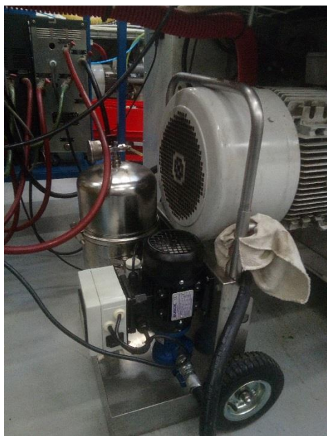
Mobilní filtrační jednotka EF V2115 zapojená na nádrži vstřikolisu

Popis systému: hydraulický systém vstřikolisu, 200 l minerálního oleje ISO VG 46.