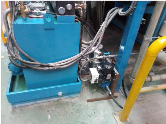
Zapojení filtrační jednotky na hydraulické nádrži-offline zapojení

Popis Systému: nádrž 400l, Plantoflux AT-S 68, Vysoká teplota oleje v nádrži (přes 80°C), zanesené chladiče úsadami, dlouhodobě vysoké znečištění oleje prachovými částicemi z provozu a s tím spojená rychlá degradace oleje.