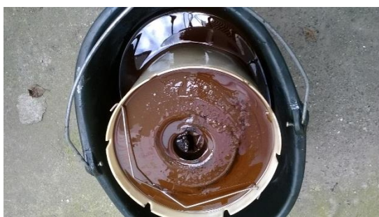
Z Zanesený filtr po filtraci. Je zde patrný výskyt měkkých kalů. Filtr je schopen absorbovat až 1755 g nečistot.

Průběh poklesu znečištění dle hodnoty MPC po dobu 10 týdnů. Probíhalo pravidelné vzorkování v rámci probíhající filtrace. Během průběhu filtrace docházelo k dalšímu uvolňování úsad.