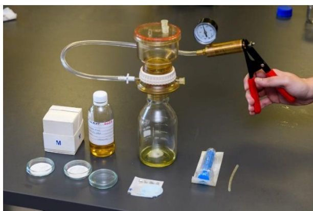
Obr. Sestavy měřícího zařízení

Toto zařízení slouží k rychlé a jednoduché zkoušce, určení znečištění oleje a olejového systému. Během pár minut se můžete pravidelně nebo v případě potřeby přesvědčit o kondici oleje a olejového systému ve vašich strojích a zařízeních.